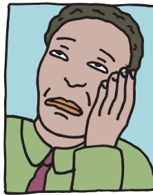
Dolor de cabeza