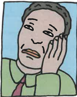
Débil o cansado