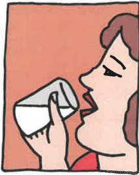
Siempre tiene sed