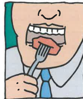
Hambriento a menudo

Un problema de nivel alto de azúcar (glucosa) en la sangre puede comenzar lentamente. Si no se trata, puede causar una emergencia de salud.