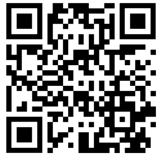
DETECTOR DE HUMOS CONVENCIONAL FCP-0320-R470 RBM1440012