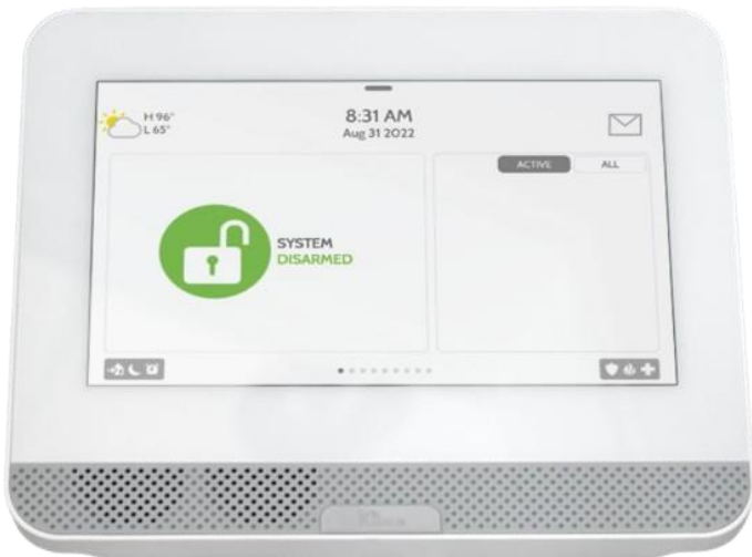
QOLSYS IQ4 HUB