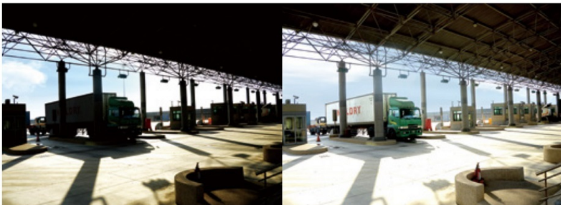
Without WDR Pro

Áreas de aduanas o inspección: Las zonas de arribo en aduanas suelen tener iluminación variable debido a la luz natural y artificial, lo que hace que la tecnología WDR Pro sea esencial para obtener imágenes claras y consistentes.